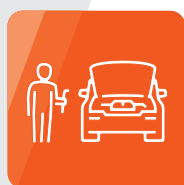
Sieć Eurorepair Car Service